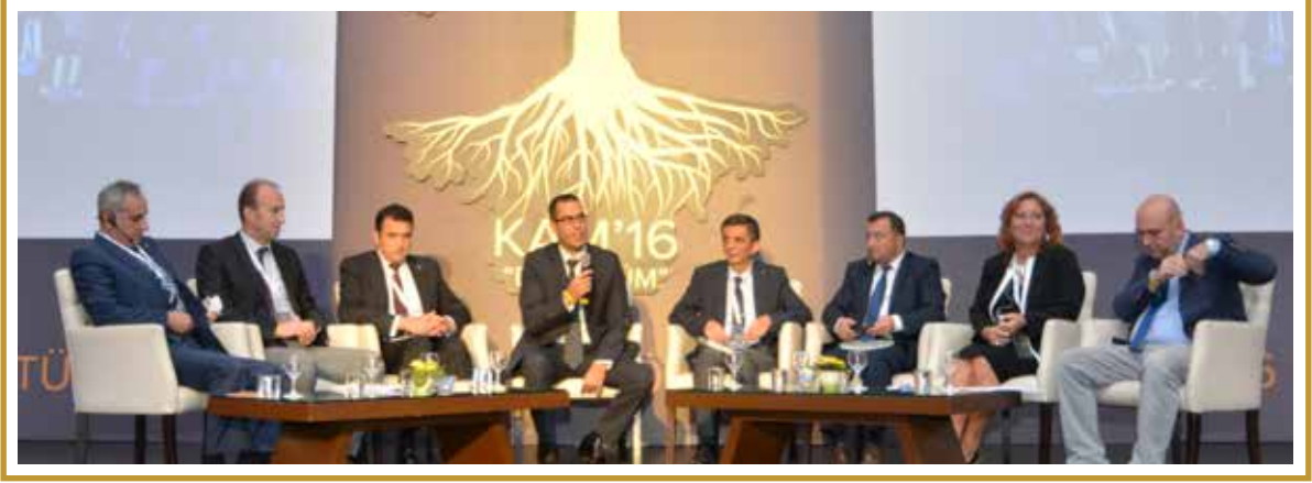
KÜTÜPHANE, ARŞİV VE MÜZE SİVİL TOPLUM KURULUŞLARI BULUŞMA PANELİ