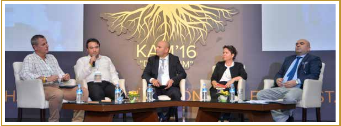
DİJİTAL KÜLTÜREL DÜNYA (1/2)