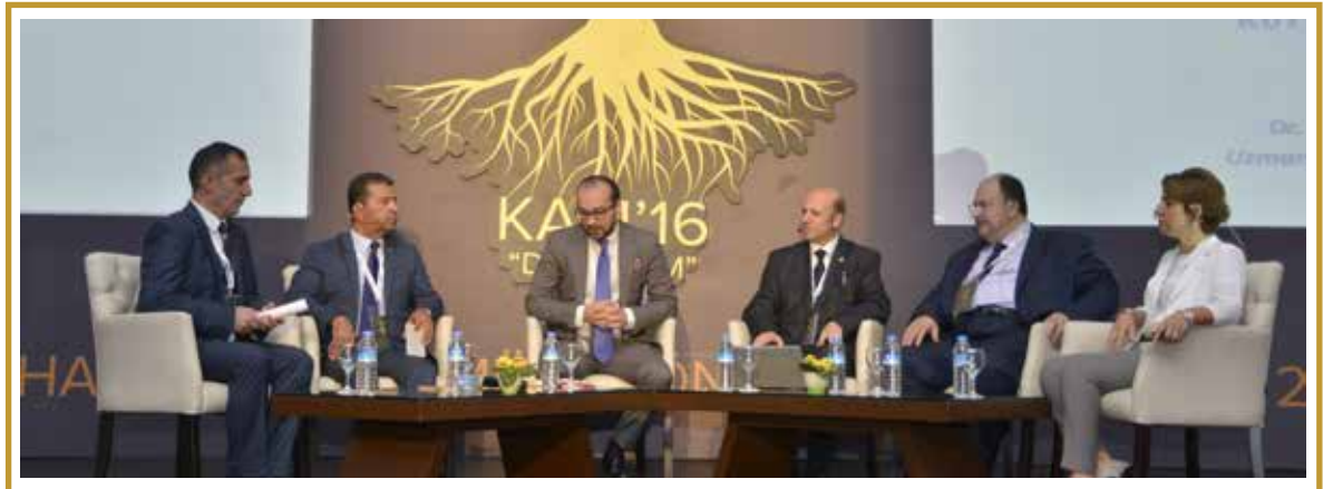
DİJİTAL KÜLTÜREL DÜNYA 2/2